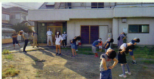
子供会夏休みラジオ体操(会館前)