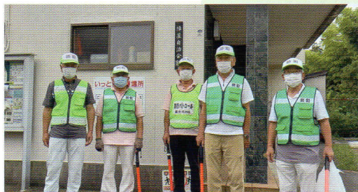
陣屋自治会パトロール隊

残念ながら、夏祭り、敬老祝賀会は中止とさせて頂きましたが、敬老お祝い金をお届けし(70歳以上対象者:168名)お祝いさせて頂きました。下半期は、秋の環境美化清掃実施(10/24、予備日 10/31)及びコロナ禍開催不透明ですが、連合等各団体行事への参加予定です。尚、会館利用が早くできるよう願っているところです。