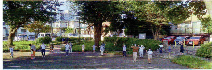
夏休みラジオ体操・アカシア公園

また7月には、寿光会と協力して「和泉第一町内会 夏休みラジオ体操」を7月21日から8月31日まで、朝6時半から和泉アカシア公園で開催し、毎回30名以上の参加者を募ることができました。子供達の生活リズム改善の一助となり、また高齢者、お父さん、お母さん、子供達共に爽やかな一日の始まりを感じながら、暑い夏を乗り切りました。最終日には、夏祭りができないこともあり、参加者に少しでも祭りを味わってもらうため、ラムネとお菓子を配布して喜んでいただけました。