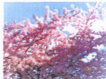
境川 しらさぎ橋の桜