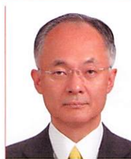
辻 琢也 氏 一橋大学大学院法学研究科教授

同志社大学文学部卒業後、CBCテレビにアナウンサーとして入社。バラエティ番組から報道番組まで幅広く担当する。「ゴゴスマ-GOGO!Smile-」(CBCテレビ制作、月~金13:55-)の番組開始時からMCを務める。2020年3月にCBCを退社しフリーアナウンサーへ転身。2019年の週刊文春の好きなアナウンサーランキングでは、在京キー局の有名アナに混じって異例の5位、2021年のJ-CASTニュースの好きなワイドショーのMCでは1位を獲得。著書「ゴゴスマ石井のなぜか得する話し方」(ダイヤモンド社)などがある。