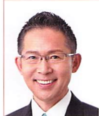
中川 貴元 氏 総務大臣政務官

早稲田大学商学部卒業、名古屋市議員(平成7年4月当選後、7期連続当選)、名古屋市議員、指定都市議長会会長、衆議院議員初当選(第49回総選挙)、自由民主党法務・自治関係団体委員会副委員長、自由民主党財政・金融・証券関係団体委員会副委員長、自由民主党地方組織・議員総局次長を経て、令和4年8月総務大臣政務官(第2次岸田改造内閣)