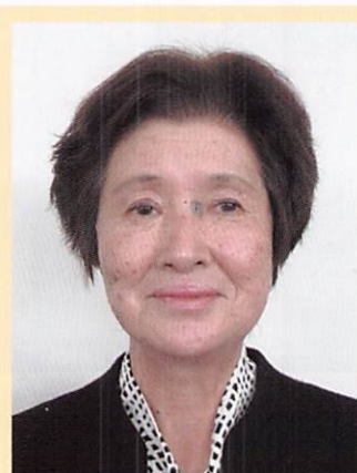
泉区民生委員児童委員協議会

「民生委員=大変だ」というイメージを払拭して、仕事を持っている方をはじめ、少しの時間があれば引き受けてもらえるような民生委員・児童委員活動を目指して、現役の私たちが知恵を出し合い、考え、実行していきますので、民生委員・児童委員の欠員がない、地域の皆様が困ることのないような泉区になるよう、ご協力をお願いいたします。