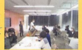
《民生委員とケアマネジャー向け》