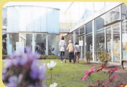
《デイサービスの利用者様と職員が中庭を歩く姿》

今回はデイサービスでの過ごし方についてご紹介します。下和泉地域ケアプラザのデイサービスと地区センターの間には、季節の花が彩る中庭があります。利用者の皆様は、天気の良い日には外気浴を楽しんだり、お話しを花を咲かせたりと、自由にゆったりと過ごされています。また、リハビリの一環として中庭を歩かれる方もいらっしゃいます。