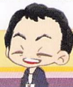
物忘れ検診パンフレット