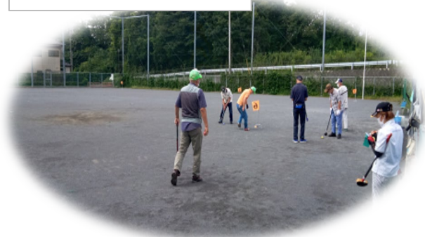
① グラウンドゴルフ