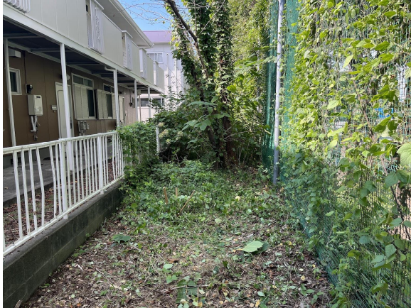
12日だんだん綺麗になってきました