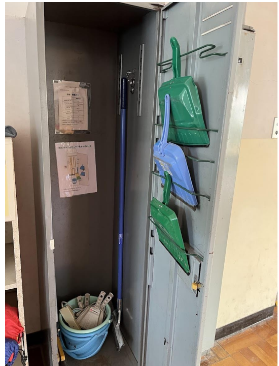
13 日北倉庫のものと取り替え