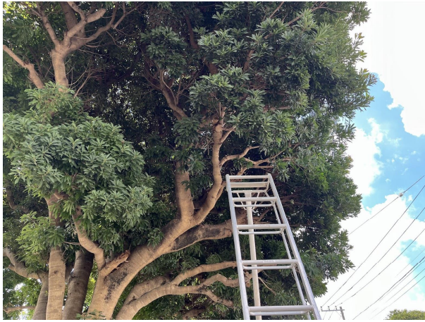
9日西門ヤマモモ剪定