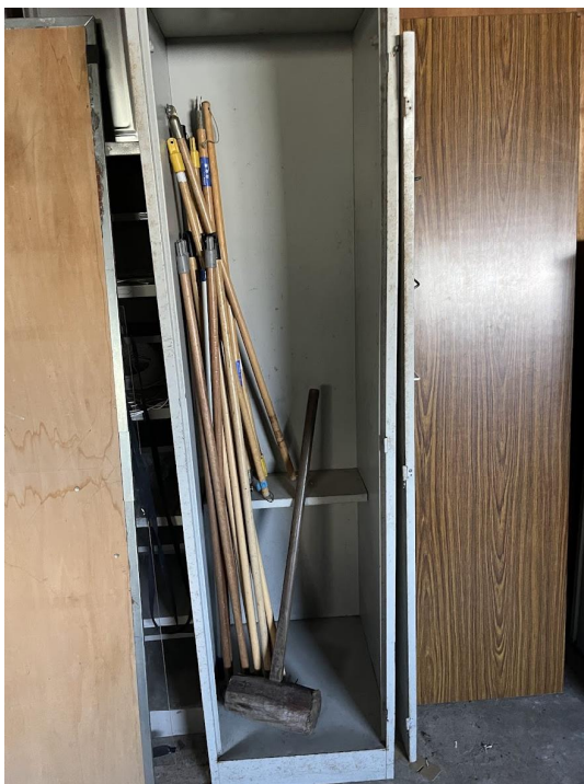
13 日昇降口のロッカー