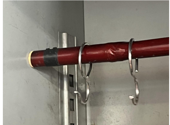
13 日ホウキかけ取り付け