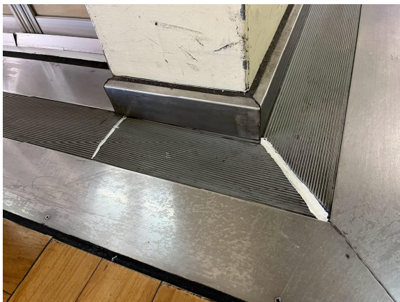
12日給食室床補修終了