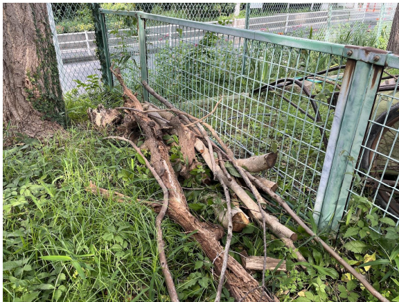
11日自然園に放置された倒木