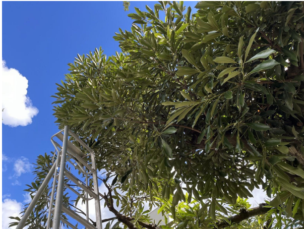
10日マテバシイ剪定