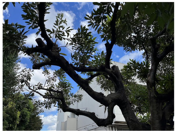
10日マテバシイ剪定