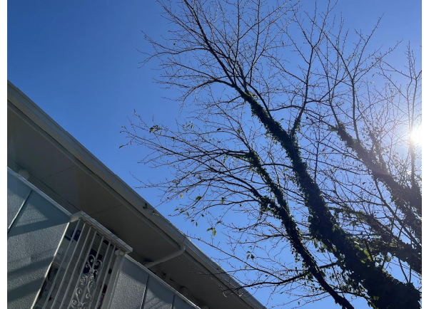
12日素人には無理なようです。