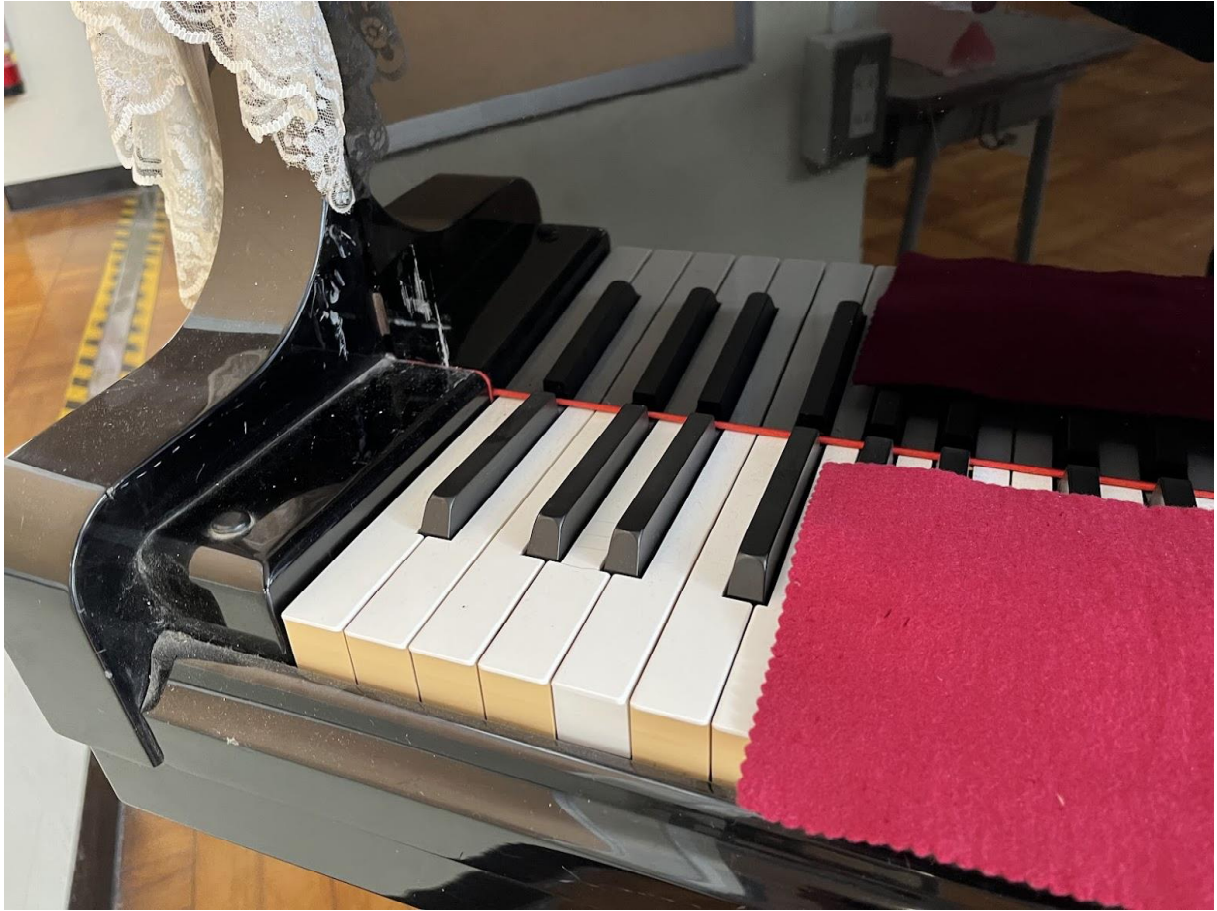
13日ピアノのふた。取り付け。副校長先生に助けてもらい、何とかセット。