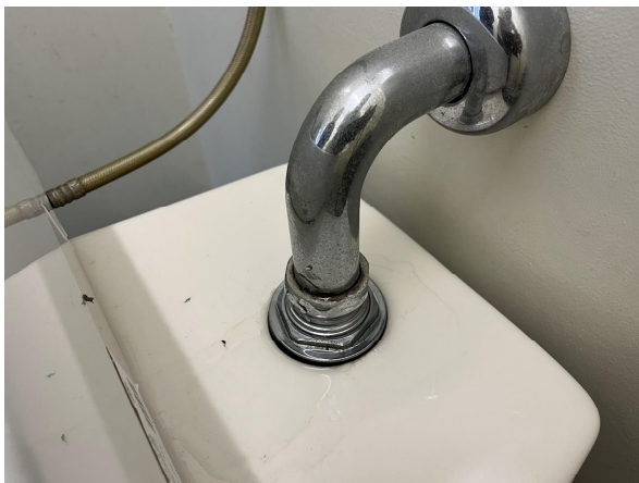
10日個別女子トイレ水もれ対応