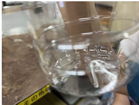
2日児童の虫取りに対応