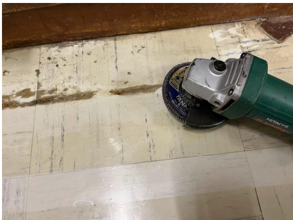
3日あまりすごいで、機械で対応