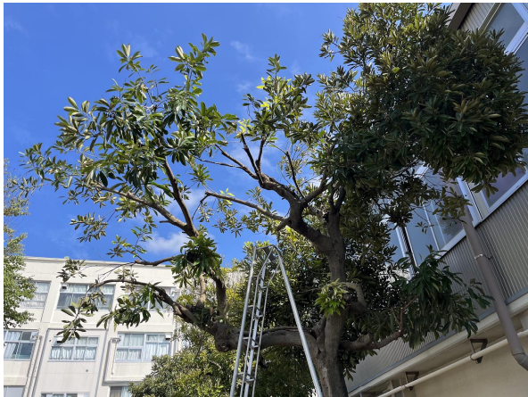
4日マテバシイ剪定