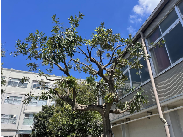
5日マテバシイ終了。さっぱりしました。