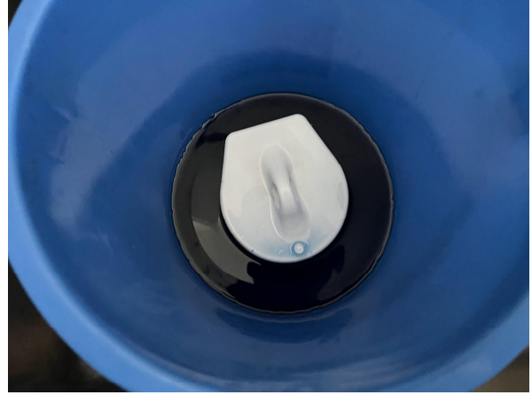
4日小便器の目皿酸の液に浸けてみた