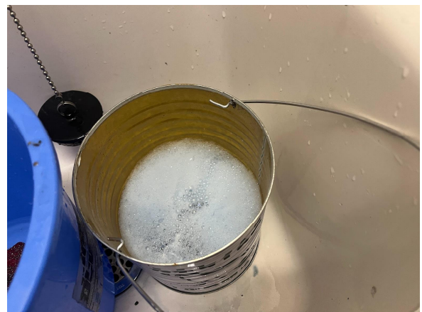
5日小便器の目皿を潰け込み