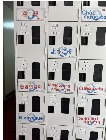
上飯田中学校の来賓用下駄箱 8カ国語でようこそ。