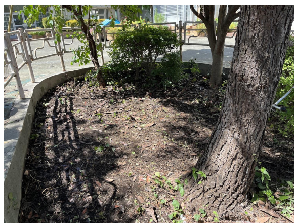
2日びわの木の下の