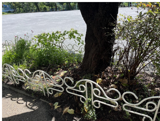
2日保健室前桜の剪定