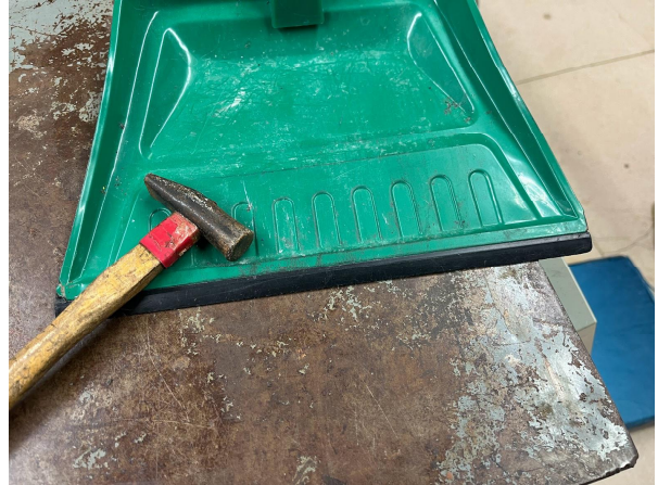
5日児童より修理以来