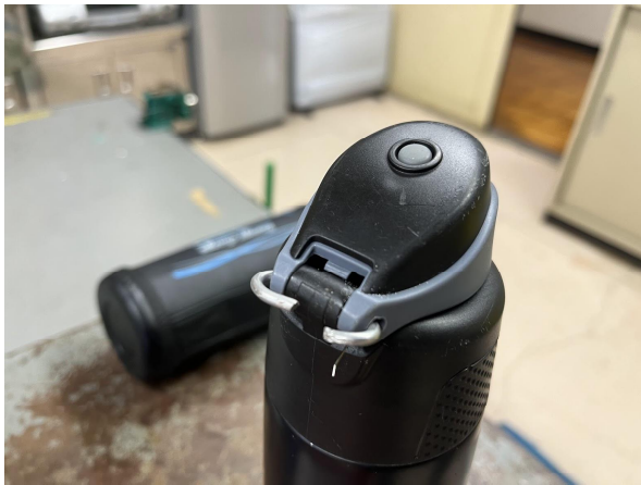
5日こべつ児童の水筒修理