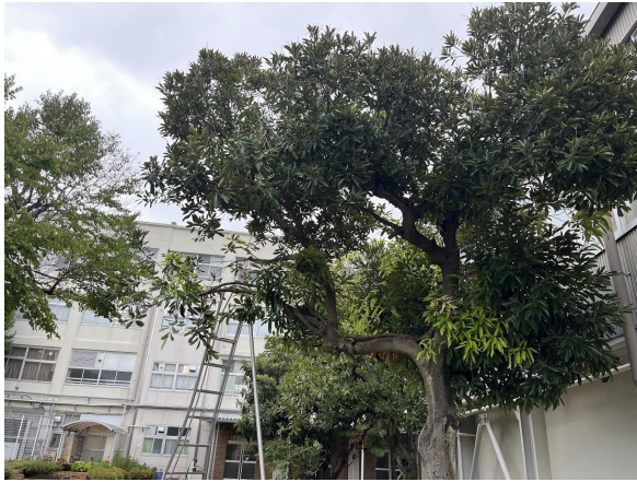
3日マテバシイ剪定