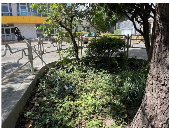
2日びわの木の下の