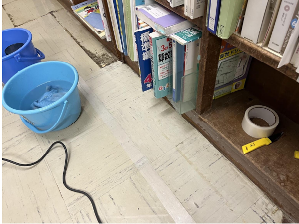
3日綺麗になりました。