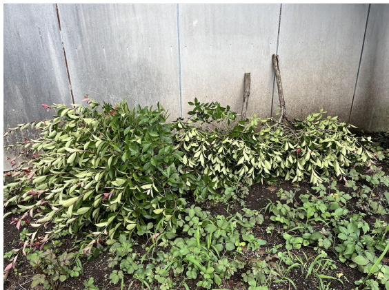
2日花サポさんの後処理