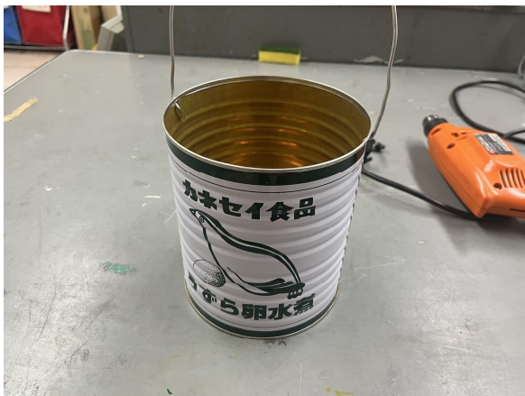
5日給食の空き缶で作業用具作成