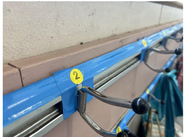
5日 2-3 組前のフック修理