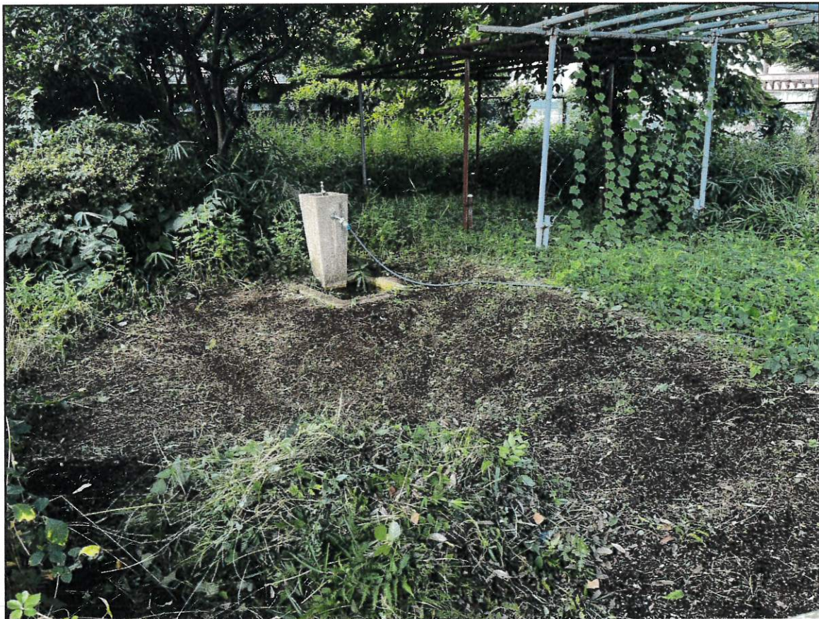
2日 水やりが、やりやすくなりました。