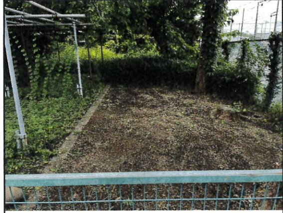
2日綺麗になりつつ・・・