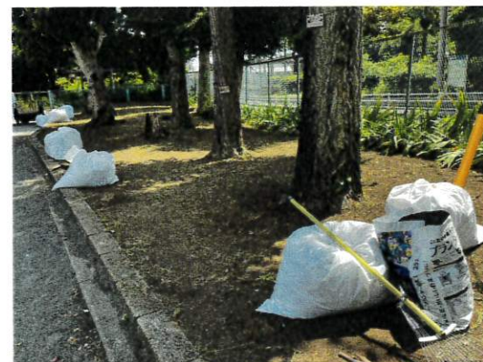
1日 西側こんなに綺麗になりました