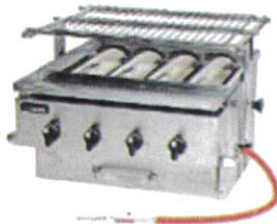
赤外線焼物器 (LPガス用)