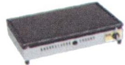
ホットプレート (LPガス用)