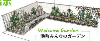
Welcome Garden 港町みんなのガーデン