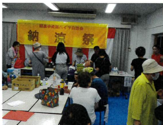
楽しかった納涼祭