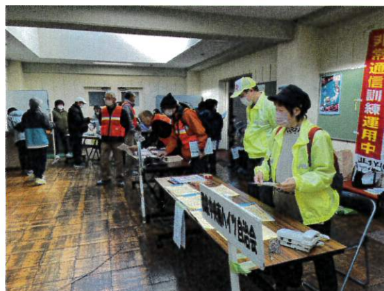
有意義だった防災訓練