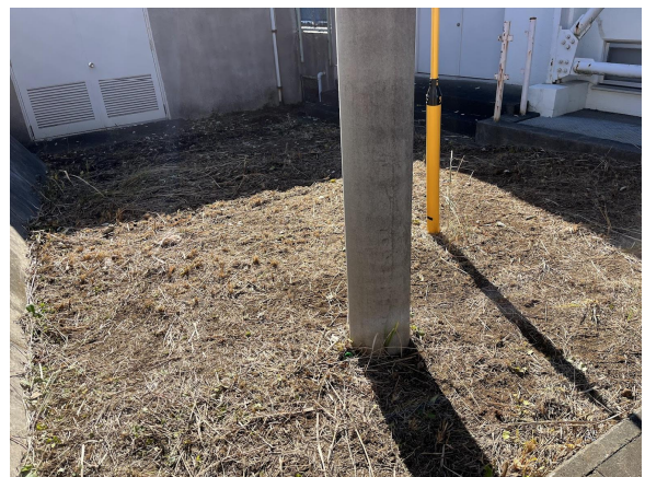
6日 綺麗になりました。