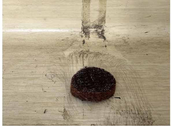
3日 階段の粘着後処理