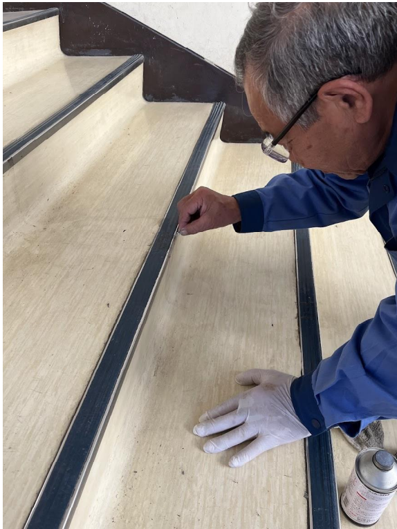
3日 階段の粘着後処理