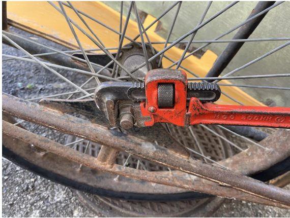
4日 リヤカータイヤ取り付け