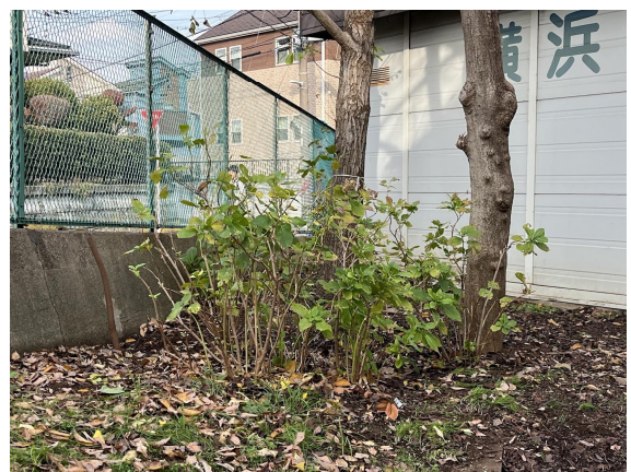
5日 綺麗になりました。