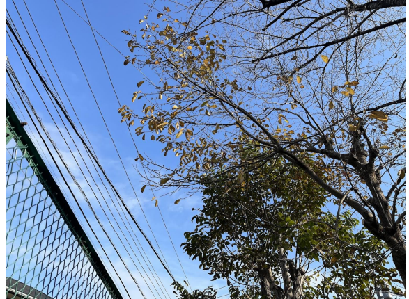
5日 防災備蓄庫横剪定