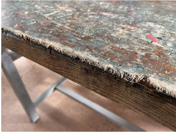
3日 図工室の作業台