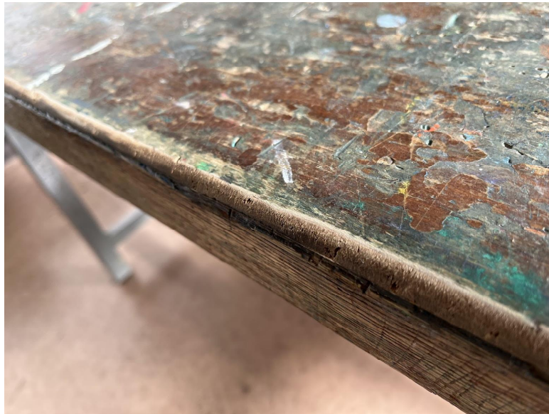
3日 綺麗になりました。