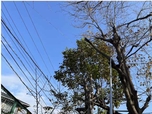
5日 サッパリしました。