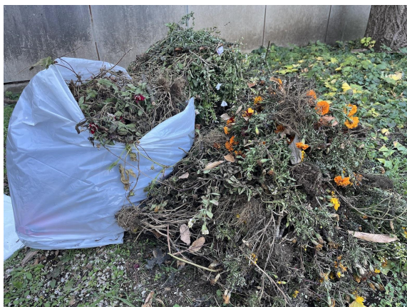
2日 花サポ 後処理