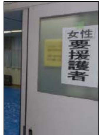
校舎内区割の表示