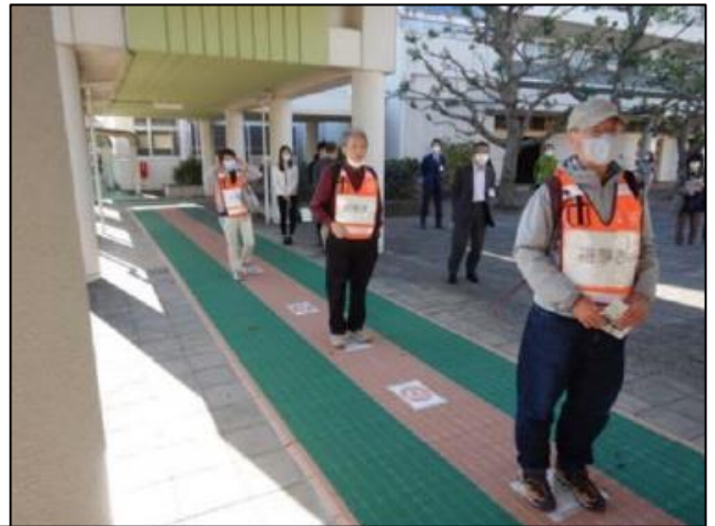
受付設置から避難者の受け入れ