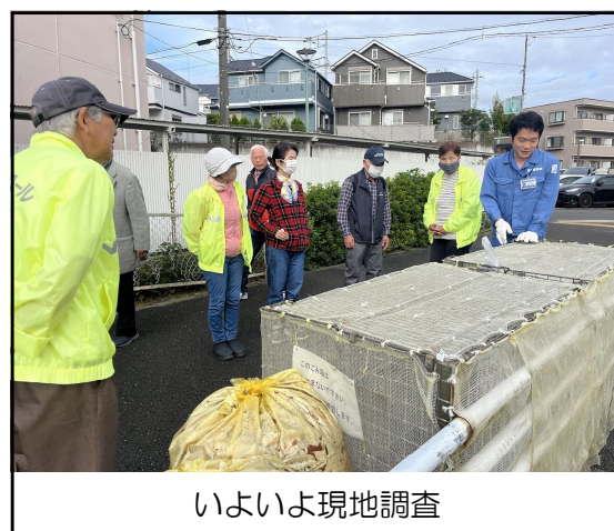
いよいよ現地調査

時間になり、連合町内会長と区役所地域振興課係長の挨拶の後、全員外に出て、2班に分かれ現地へと向かった。1カ所はすでに回収に来てしまった。次の4号棟のところで、ゴミの箱からいろいろ出し、紙が多く入っている袋。シュレッダーゴミが入っているものなど、若干マナー違反が見受けられた。これには収集できませんのステッカーを貼り、注意喚起を行った。