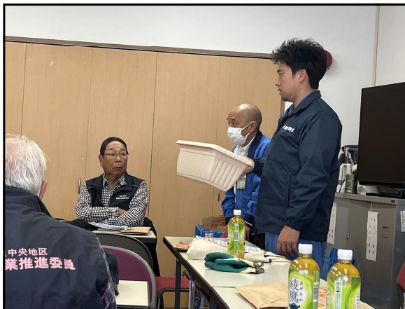
このような大きなものは

集会所に戻り意見交換会。後半ではプラスチックゴミの仕分けについて実施訓練。パンフレットを読んでいるつもりであったが、見間違いしているものも沢山あった。資源は大事にしなければと、素晴らしい内容であったが、参加者が少ないのが残念であった。