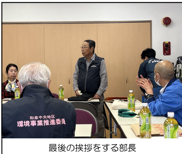
最後の挨拶をする部長

大きなものは粗大ゴミに出してね。長いひもは帰化に絡むので一般ゴミに出してね。など、冊子を見ながら懇切丁寧に説明された。連合の定例会で話してほしいねと思いました。