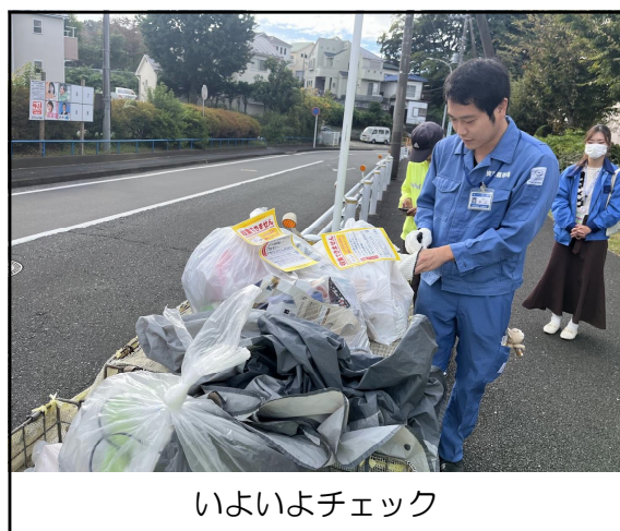
いよいよチェック

時間になり、連合町内会長と区役所地域振興課係長の挨拶の後、全員外に出て、2班に分かれ現地へと向かった。1カ所はすでに回収に来てしまった。次の4号棟のところで、ゴミの箱からいろいろ出し、紙が多く入っている袋。シュレッダーゴミが入っているものなど、若干マナー違反が見受けられた。これには収集できませんのステッカーを貼り、注意喚起を行った。