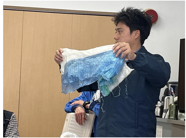
プラスチックの出し方

集会所に戻り意見交換会。後半ではプラスチックゴミの仕分けについて実施訓練。パンフレットを読んでいるつもりであったが、見間違いしているものも沢山あった。資源は大事にしなければと、素晴らしい内容であったが、参加者が少ないのが残念であった。