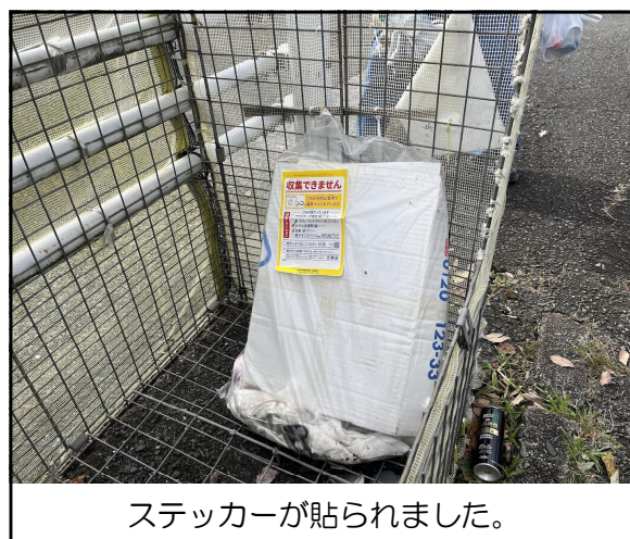
ステッカーが貼られました。