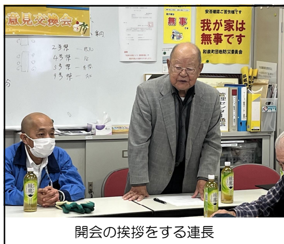
開会の挨拶をする連長

今日は8時半集合になっていたが、環境の部長は7時半頃には会場に来ていた。8時過ぎには自治会メンバーも多く7名も来てくれた。しかし、他の町会からは1名。途中1名駆けつけてくれた。連合役員など含め約20名の参加であった。