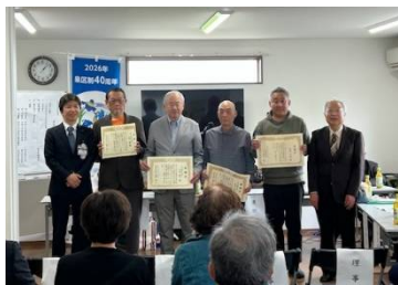
永年在職者表彰の様子