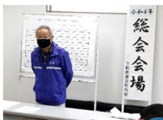
※詳細は、連合会館(2F ホール)にて閲覧できます。