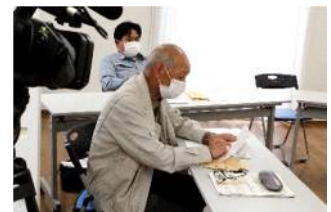
理事による開票の様子