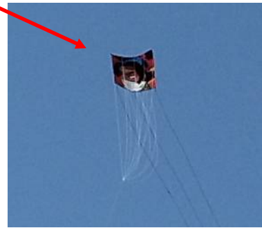
青空に揚がる親子凧