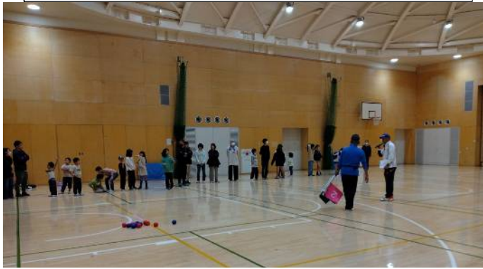
個人の部（約2.5m位離れた目標地点にどれだけ近づけられるか）に並ぶ人たち