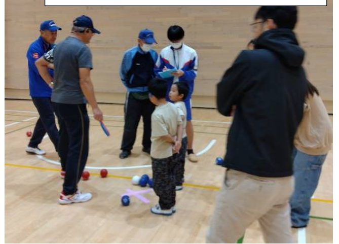
スコアを付けるわくわく応援隊の男子 この後で彼は凄いことをやってのけます