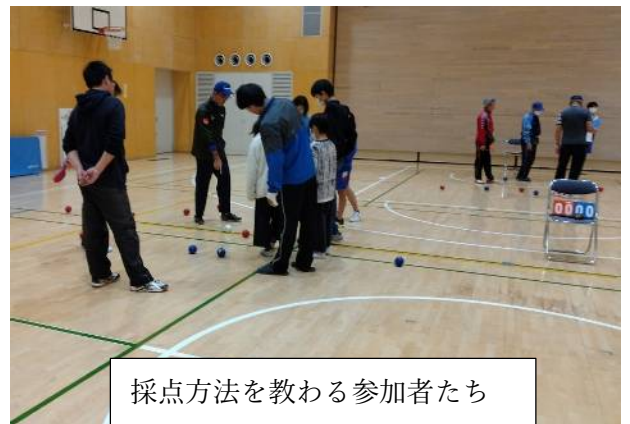
採点方法を教わる参加者たち