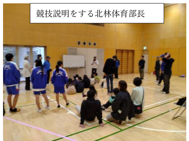
競技説明をする北林体育部長