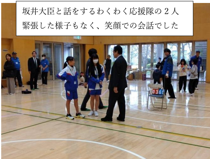
坂井大臣と話をするわくわく応援隊の2人 緊張した様子もなく、笑顔での会話でした