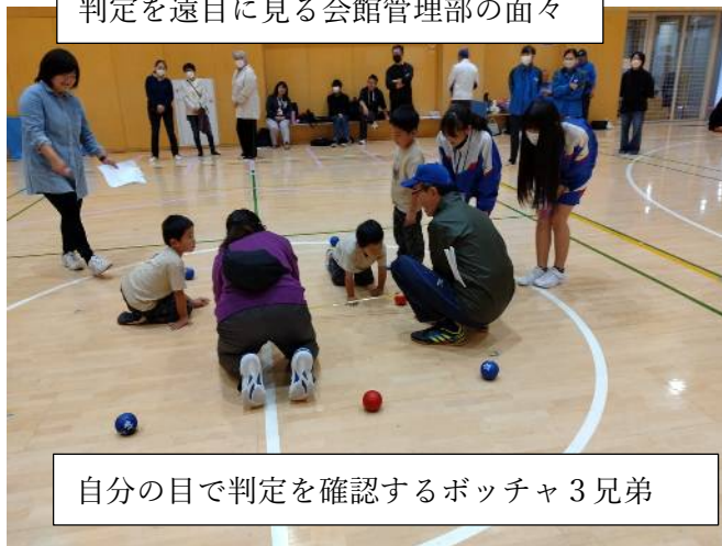
自分の目で判定を確認するボッチャ3兄弟