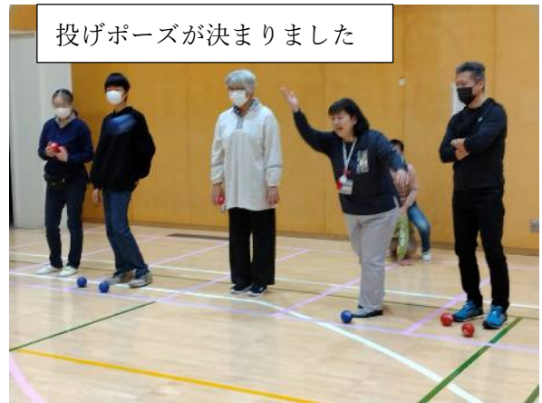
投げポーズが決まりました