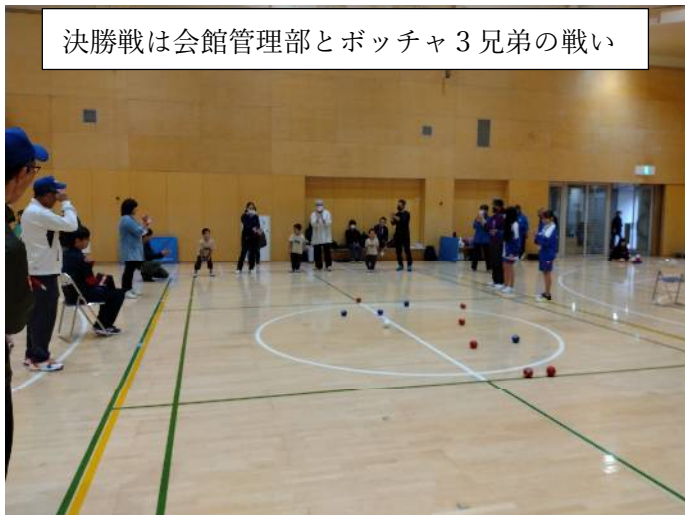
決勝戦は会館管理部とボッチャ3兄弟の戦い