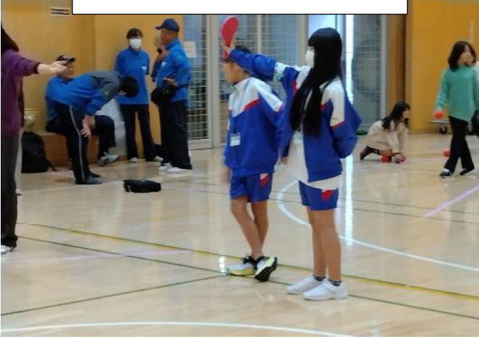
投球指示出しも慣れてきました