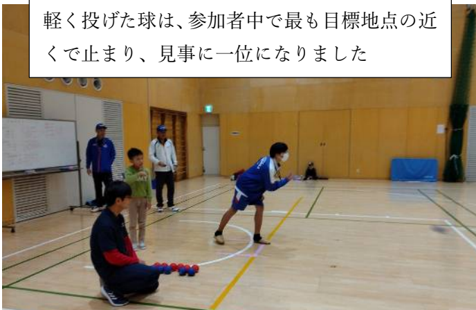
軽く投げた球は、参加者中で最も目標地点の近くで止まり、見事に一位になりました