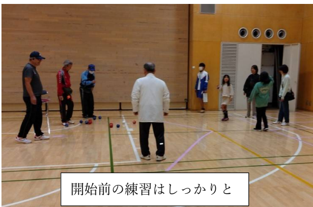
開始前の練習はしっかりと