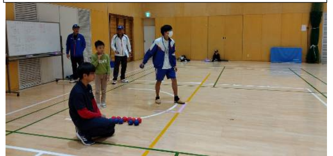
わくわく応援隊の彼が最後に登場 ボランティア活動でスコアつけをやって居たので、練習はしていない。 ぶっつけ本番の投球