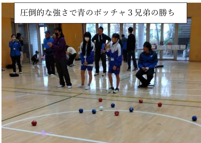
圧倒的な強さで青のボッチャ3兄弟の勝ち