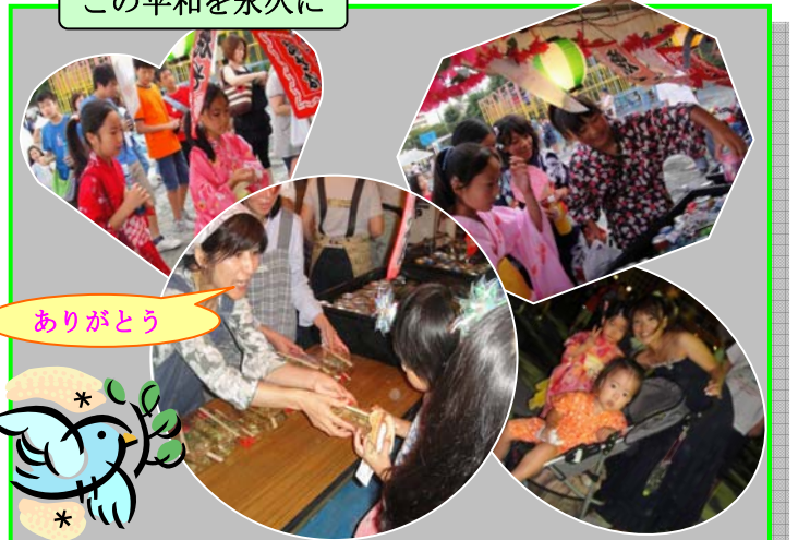
この平和を永久に