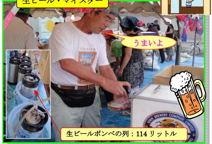
生ビール・マイスター