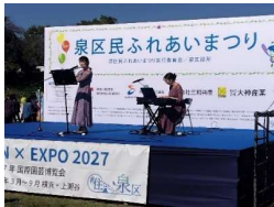
フルーツとピアノ演奏

模擬店ブースでは、多くの飲食物のほか物品販売、遊戯コーナー、横浜市のごみ収集、防犯、防災関連の啓蒙活動ブースなどがありました。建設機械のクレーン試乗会には沢山の人が参加できていました。