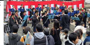
いずみ野中学校吹奏楽部の演奏