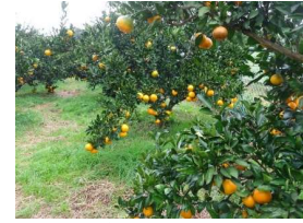
たわわに実ったミカンの木

果物は様々な虫害があるのですが、この果樹園ではできるだけ農薬を使わず、自然の力を利用して生育に努めているとのことでした。ミカン狩りは11~12月中旬が旬で、6~7月にはブルーベリー狩りもできるとのことでした。私たちの住むこの身近な新橋地区に、ミカン狩りやブルーベリー狩りを