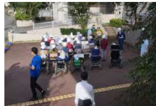
新橋ホームの防災訓練風景

これからは、新橋下自治会や近隣住民のネットワークを活用し、災害発生時に素早く協力できる体制を構築することがいかに大切か考えさせられた訓練でした。