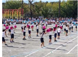
低学年の集団演技

低学年の集団演技はとても可愛らしくて微笑ましく、会場から沢山の拍手が聞こえました。徒競走では、高学年になると大人顔負けのスピードで、子ども達の成長を肌で感じました。