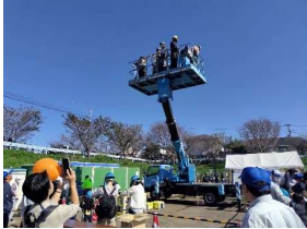
クレーンの試乗会

模擬店ブースでは、多くの飲食物のほか物品販売、遊戯コーナー、横浜市のごみ収集、防犯、防災関連の啓蒙活動ブースなどがありました。建設機械のクレーン試乗会には沢山の人が参加できていました。