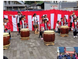
鳩の森愛の詩保育園の可愛い和太鼓演奏

模擬店は焼きそば、焼き鳥、豚汁、甘酒、カレー、綿あめなどの飲食店から、輪投げ、ストライクナインなどの遊戯店もあり、いつもより多くのお店が出店されました。