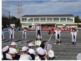
応援団のエール交換

運動会は赤、白、青の3チームに分かれての対抗戦でスタートです。6年生の力強い開会宣言で始まり、各チームの応援団がエールを交わしました。