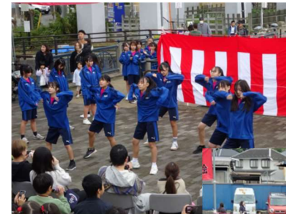
岡津中学校ダンス部のキラキラのダンス

広場中央の催し物広場では、鳩の森愛の詩保育園の園児並びに卒園生による可愛い和太鼓演奏や、新橋小学校生徒による演技、岡津中学校ダンス部のキラキラのダンス、いずみ野中学校吹奏楽部の演奏、フラダンス、