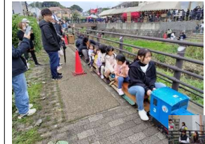
子ども達に大人気のミニ列車

会館2Fでは作品展が開催され、多くの住民が見学に来ていました。竹炭の無料配布もありました。