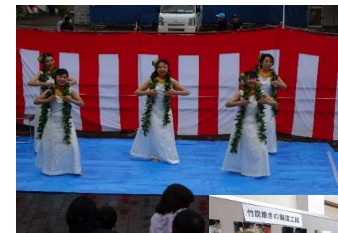
フラダンスの演技