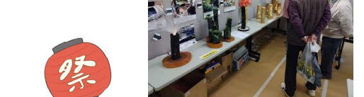
作品展の展示会場

今回は模擬店が広場全体に分散配置され、人混みが集中しないよう、狭いスペースを有効活用する工夫がなされ、とてもよかったです。アッテ祭りの実施に際してはびぐれっと、鳩の森、新橋小学校の先生、いずみ野中学校の生徒さんなど多くの方のご協力がありました。スムーズに進行することができました。感謝です