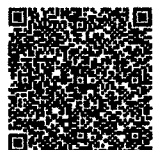
申込用二次元コード

二次元コードを読み取り、申し込みフォームに必要事項を入力してください。 二次元コードが読み込めない場合は、泉消防署のウェブページからアクセスしてください。