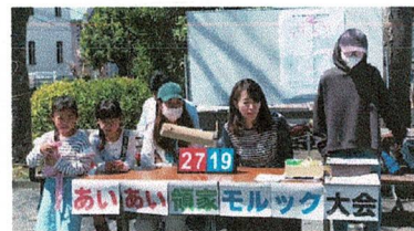
子どもたち母たちも得点係を担当

これからも子どもから大人まで地域のみinnが交流ができるイベントを開催していきたいと思ひます。