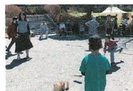
力を込めてエイッ!