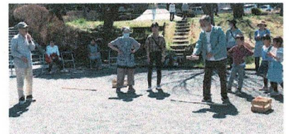
シニアも負けじと頑張りました