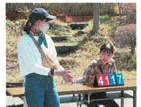
若いボランティアさんも