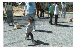
ミラクルショットの予感