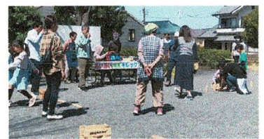
スキttlもみんなで起こして