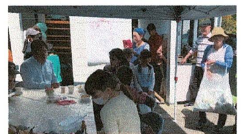
4番館のお庭でカレーパーティー