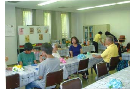
4丁目西で、「居場所」(お茶会)が開かれた。