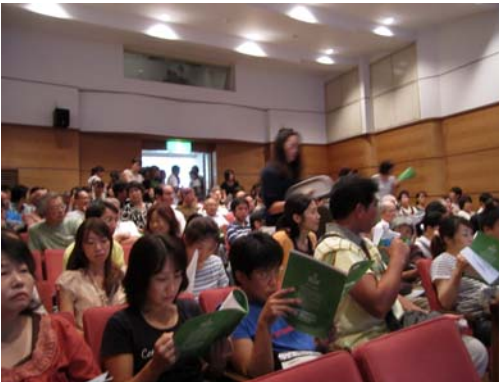
会場の方々は熱心に聞かれ質疑も盛んに行われました。

9月5日(日)14:00よりサンステージ西の街ホールにおいて緑園地区住民フォーラムが開催されました。