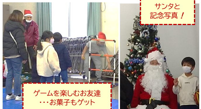
ゲームを楽しむお友達 ...お菓子もゲット

コロナに対するスタンスに変化の兆しがあった令和3年でしたが、それでも大きなイベントには躊躇せざるを得ない心情もあって、町内会の活動については厳しい状況でした。そんな中、ささやかイベントでしたが、何らかの形で、子供たちの記憶に残ってくれたら、幸いです。