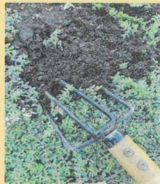
小さな熊手(ガーデンフォーク)

小さな熊手(ガーデンフォーク)やねじり鎌で、株の間を軽く耕すことで、雑草の発生が抑えられます。さらに空気の通りがよくなり、花の根の生長も促進されます。