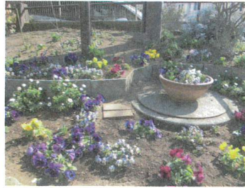
港北区錦が丘公園愛護会の花壇