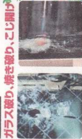
ガラス破り、焼き破り、こじ開け

窓まわりからの侵入は約55%、窃盗侵入口のワースト1です。ガラス破り、サッシ、シャッターのこじ開けなどによる侵入が発生しています。網入りガラスや錠まわりのみのフィルム貼りでは、侵入窃盗は防げません。まずは、ご自宅の窓まわりをチェックしてみよう。(令和4年警察庁統計)