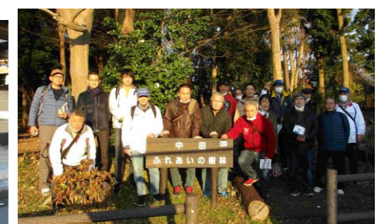
中田ふれあいの樹林