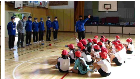
積極的に発言する生徒