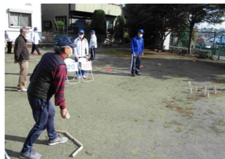
「町のはらっぱ」でのモルック体験の様子