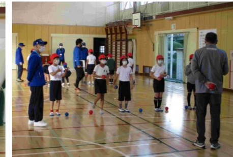
熱心に説明を聞く生徒たち