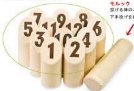
モルック 投げる棒のことをモルックという。 下手投げを行うのが基本。