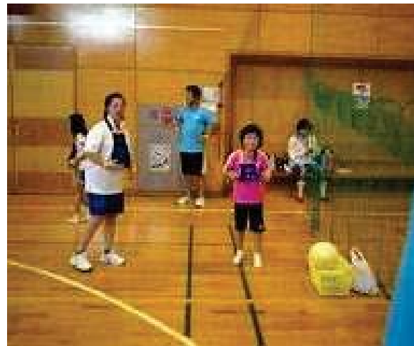
【 室内ペタンク 】