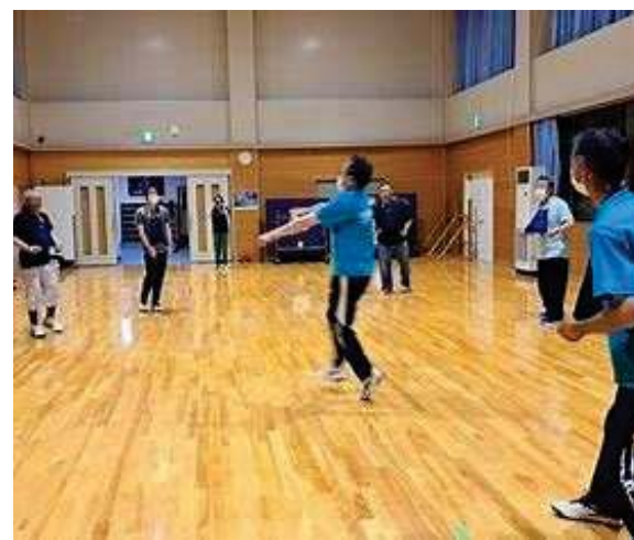
【 シャフルボード 】