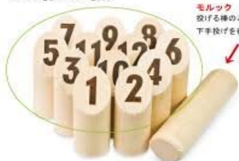
モルック 投げる棒のことをモルックという。 下手投げを行うのが基本。