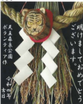
天王森泉公園 ボランティア作 かかしコンテスト 優勝者 明けましておめでとうございます。

公園は、今年11月で、開園25周年を迎えます。近隣地域および市民に愛される公園にむけて活動いたします。みなさまのご協力をお待ちしております。尚、新型コロナウィルス感染防止対策として3密(密閉、密集、密接)対策を行っております。ご不便お掛けしますがご理解、ご協力の程宜しくお願い致します。