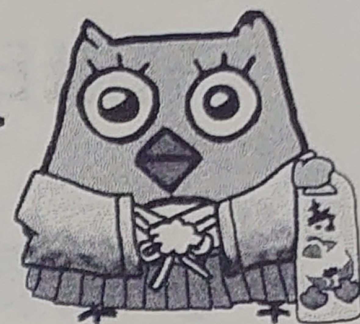
イメージキャラクター しもずく

地域ケアプラザは、介護の悩みなど生活の困りごとの総合相談窓口です。 ご相談の際は、事前にご連絡いただくと助かります。 相談時間は、9時～17時です。第4月曜日は、休館日になります。