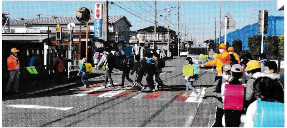
3月3日 横断歩道を渡る小学生と富士塚自治会「学援隊」