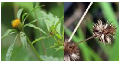
アメリカセンタングサ(先端の2本は逆刺)