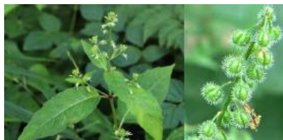
ミズタマゾウ(実にカギ状の毛がある)