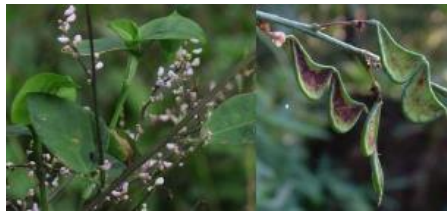
ヌビトバギ(実の表面にカギ状の毛が密生)