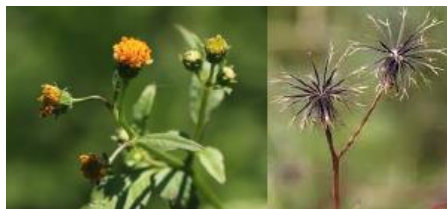
コセンタングサ(先端の3~4本は逆刺)