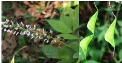
フジカンゾウ(実の表面にカギ状の毛が密生)