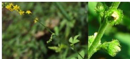
キンミズヒキ(実にカギ状のトゲがある)