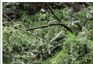
【ワサビ田に落ちた折れたミズキ】

少なくなったワサビは伊豆のワサビ園から10月に新しい苗が届くことになっています。11月の天王森祭りには少し綺麗になったワサビ田を見てください。