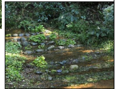
【片付け終わったワサビ田】