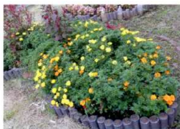
マリーゴールド 花壇