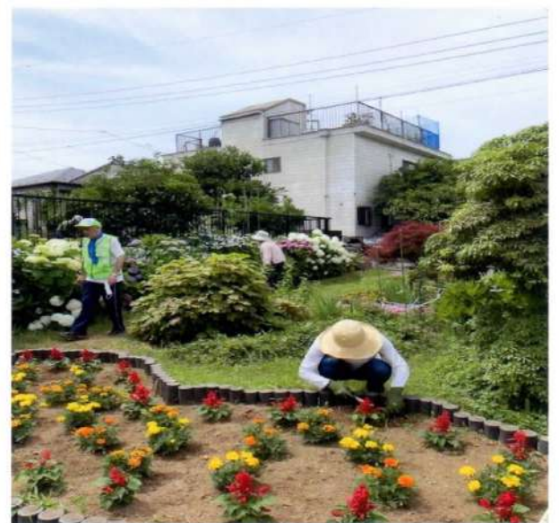
たいへん暑い中での作業でした お疲れさまでした！