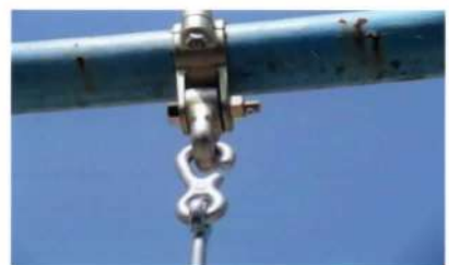
ブランコの吊り具一式(フック・チェーン・座板)が新規交換