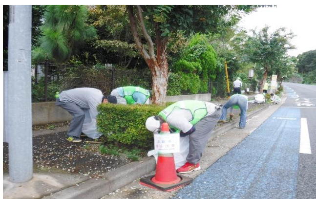
安全に注意しての作業風景