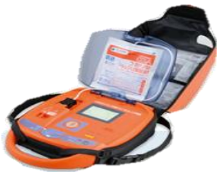
自治会館に設置のAED

実際の現場で躊躇なくAED使用するためには、講習を受けておくことが必要です。これからもAED訓練の機会を設けていきますので、その折には是非訓練に参加して知識と技術を学びましょう。