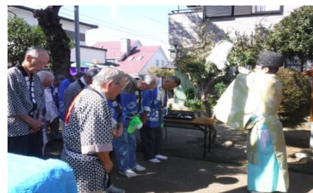
昨年の住宅祭風景