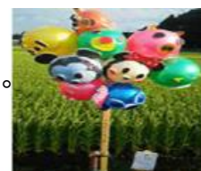
LNEで遊びま賞：ツムツム ワンダフルで賞：スヌーピー (下和泉住宅自治会) (下和泉住宅自治会・たんぽぽ)