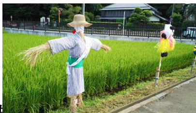
防災隊の目標です