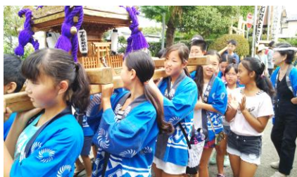
威勢よく気合を入れてソイヤッ！！