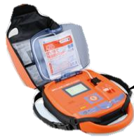
自治会館に設置の AED