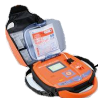
自治会館に設置の AED