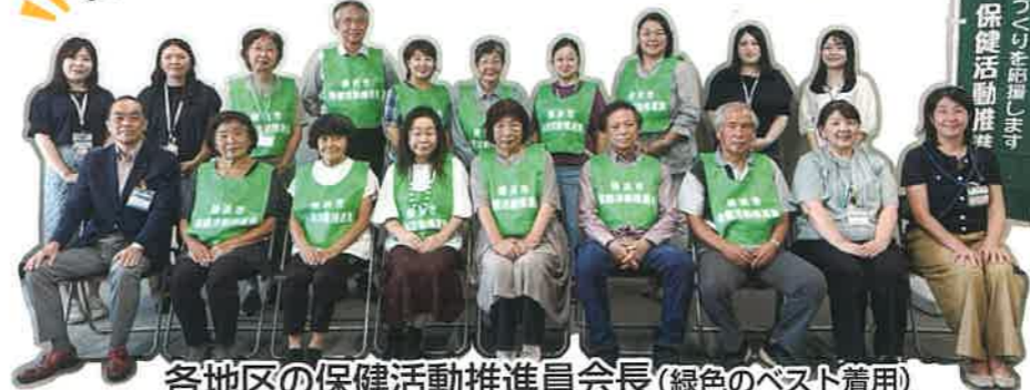
各地区の保健活動推進員会長(緑色のベスト着用)