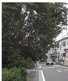
歩道帯からはみ出し