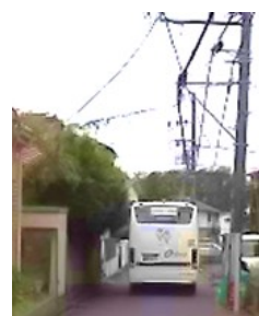
Eバスがギリギリ通過