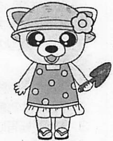
横浜市交通安全キャラクター ルールちゃん