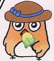
イメージキャラクター しもずく

地域ケアプラザは、介護や生活の困りごとの総合相談窓口です。 ご相談の際は、事前にご連絡いただくと助かります。 窓口でのご相談は、9時～18時の間に対応します。(日・祝は17時まで) 第4月曜日は、休館日です。(祝日の場合は翌日の火曜日) 7月は7月27日(月)が休館となります。