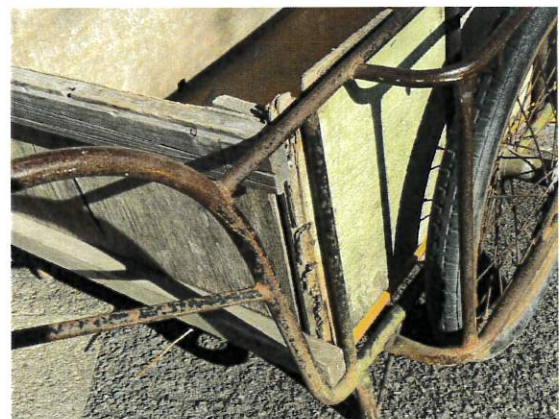
7日 使い切ったリヤカー