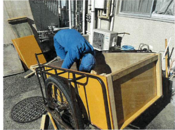
ほぼ出来上がりました。