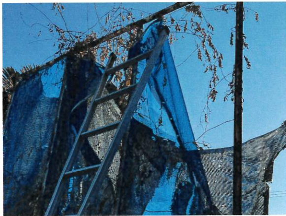
6日 プールサイドのネット修理