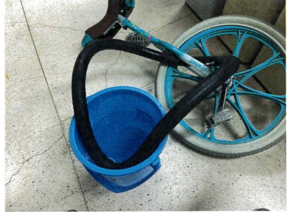
6日 一輪車パンク修理