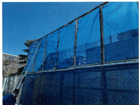
6日 プールサイドのネット修理