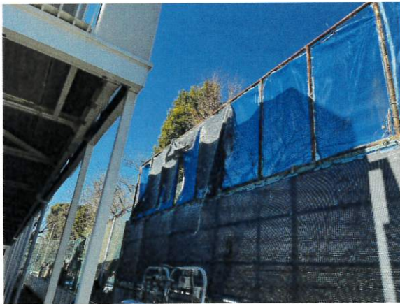
6日 プールサイドのネット修理