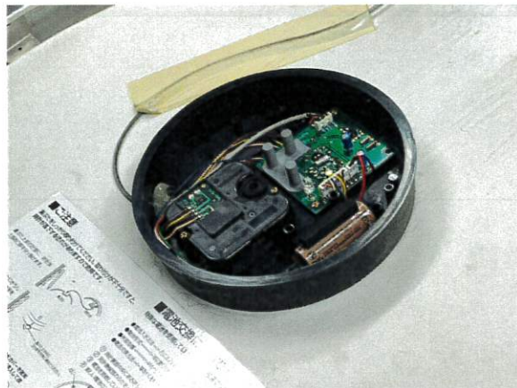
電池交換と時刻調整