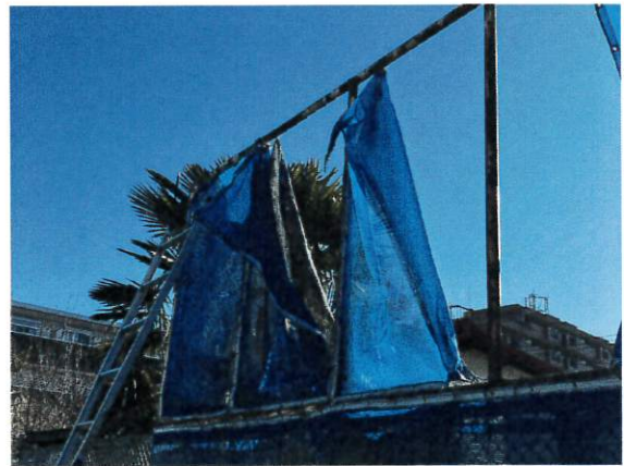
6日 プールサイドのネット修理