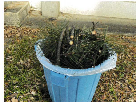
4日 待つ選定枝後処理