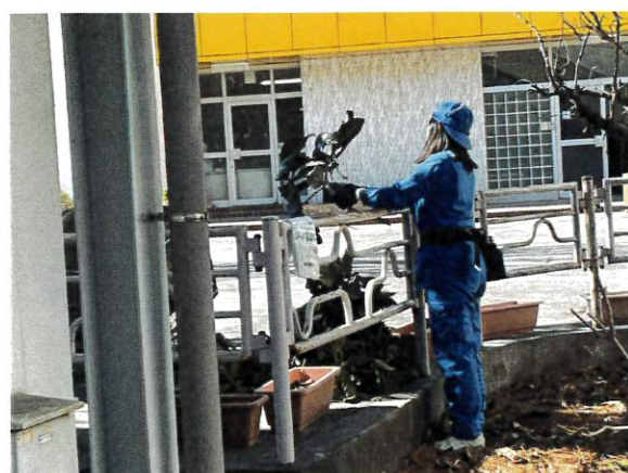
4日 びわ選定枝後処理