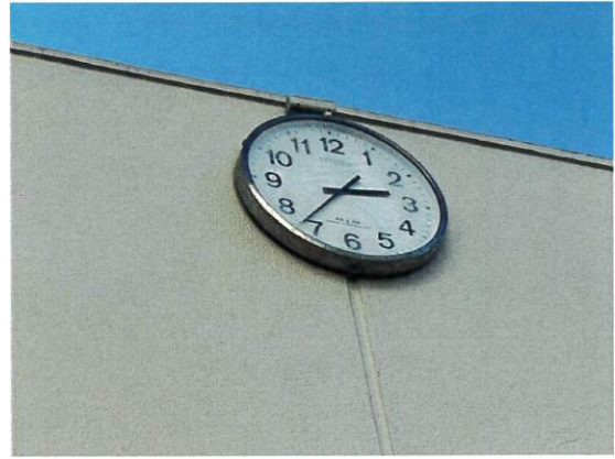
5日 時を刻み始めました。