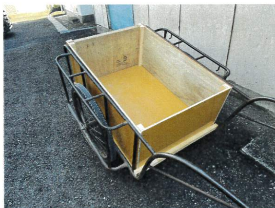
生まれ変わりました。