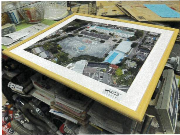
6日 航空写真額のガラス破損