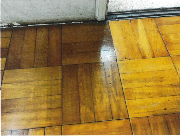
4日 明暗がはっきり