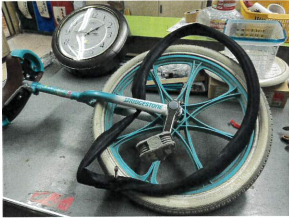
6日 一輪車パンク修理