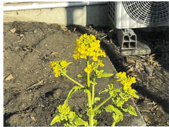
おいしそうに咲いています。