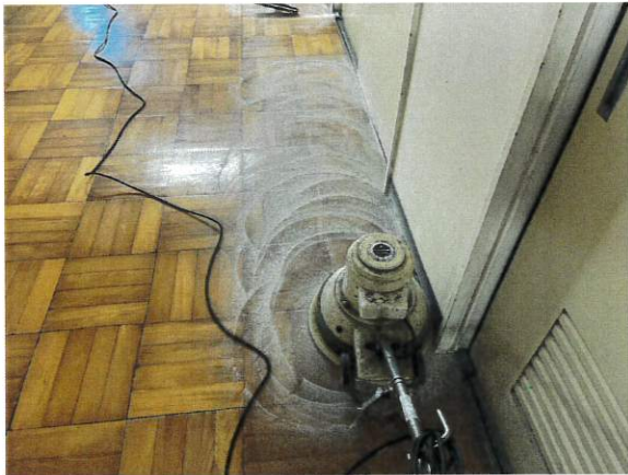
6日 廊下ワックス作業