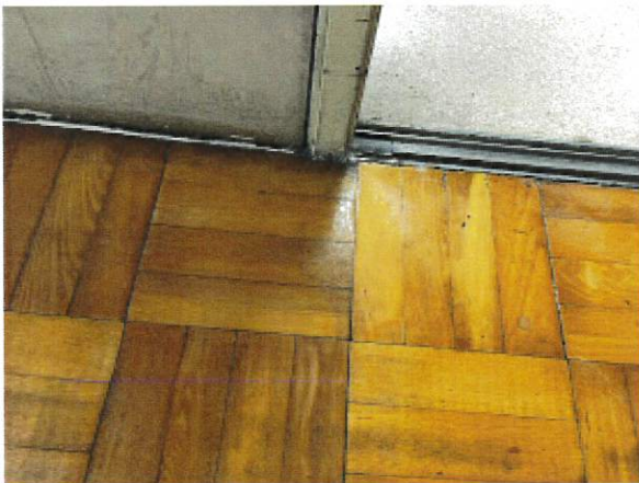
4日 明るくなりました。