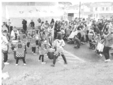
鳩の森愛の詩保育園児による和太鼓演奏

令和5年11月12日、第28回新橋アツテ祭りが開催されました。一昨年は、新型コロナ感染拡大で飲食無しのやや寂しいものでしたが、今年度は新型コロナも落ち着きほぼ日常に戻ってきたので、飲食も解禁となり多くの模擬店が出店し、長い行列ができていました。またアトラクションでは、鳩の森愛の詩保育園の園児たちによる和太鼓演奏や、岡津中学校や新橋小学校の生徒さんによるダンス披露などがあり大変盛り上がりしました。来場者数もコロナ以前に近い人出となり、大盛況のうちに無事終了しました。