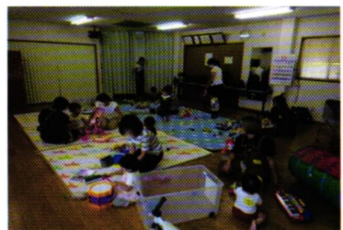
子育てサロンの様子