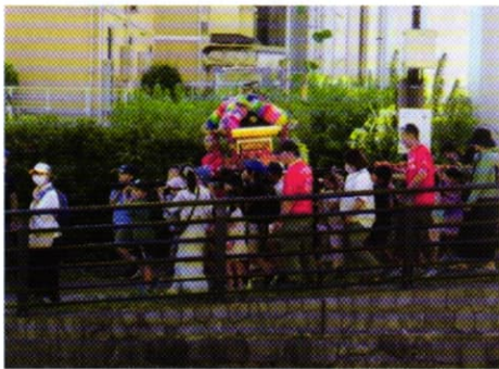
子ども神輿でワッショイワッショイ!

子ども神輿は17時頃スタート。コースは広場から阿久和川右岸をえのき橋まで下り、左岸を戻って来るコースです。道が狭く心配しましたが、沢山の子ども達が参加し、大きな掛け声を出しながら練り歩きました。