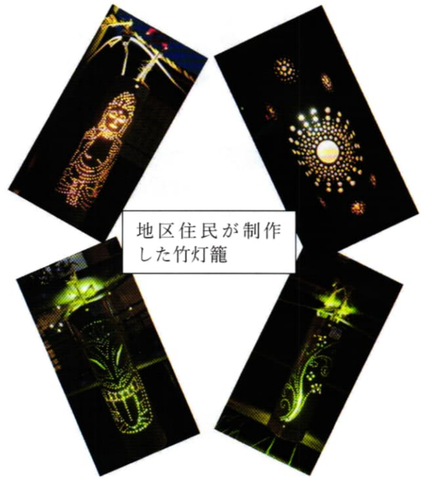
地区住民が制作した竹灯籠