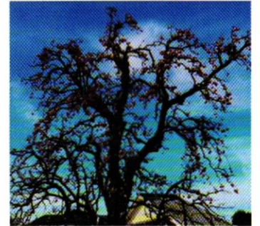
たわわに実った柿の木 (11月)

す。9月現在はつやつやした深緑の葉を茂らせ、そこから青い実が顔を覗かせていますが、11月には写真のように見事に色づいた柿の実がたわわに実った姿を見ることができます。古木の健康のため、敷地内には入らずに鑑賞して頂きますようお願いいたします。