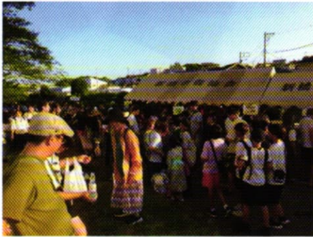
模擬店はお客で大混雑

祭り当日は多くの住民が訪れ、会場は大賑わいでした。広場の模擬店では、焼き鳥、焼きそば、かき氷、フランクフルト、カレーなどが販売され、長い行列ができて大混雑でした。また、会館前の駐車場では子ども向け射的やじゃんけんゲームなどが行われ、黒山の人だかりができていました。