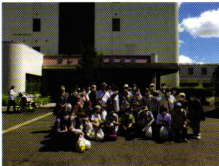
あしたか太陽の丘で記念撮影

9月10日、新橋地区社協の研修バス旅行が行われ、記者も同行しました。訪問先は、沼津市の社会福祉法人あしたか太陽の丘施設です。この施設は、様々な障がいをもつ人たちが共同生活や通いで、自立や社会復帰を目指して訓練しています。施設は今まで訪問した中では最大規模で、合計380人が入所と通所で利用しているとのこと。作業現場を見学させて頂き、皆さんが企業などから委託された業務を一生懸命取り組んでいる姿には心打たれるものがありました。