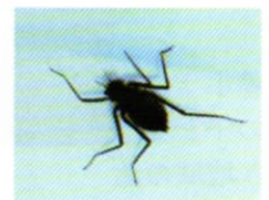
コヤマトンボのヤゴ