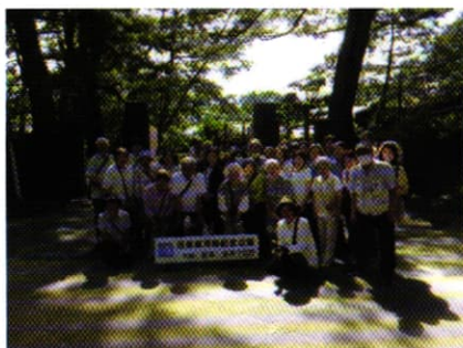
沼津御用邸で記念撮影